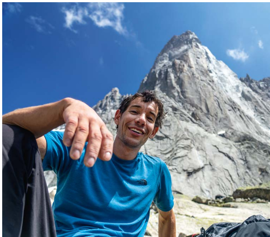
Alex Honnold am Wandfuß der Petit Dru nach einer erfolgreichen Free-Solo-Begehung der American Direct.

Ich glaube nicht. Ein professioneller Kletterer wäre ich zwar trotzdem, weil ich genügend Erstbegehungen unternommen und Speed-Rekorde aufgestellt habe, aber wahrscheinlich nicht so bekannt. Free Solo ist erst richtig in die